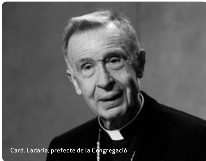
Card. Ladaria, prefecte de la Congregació

Nota de la Congregació per a la Doctrina de la Fe